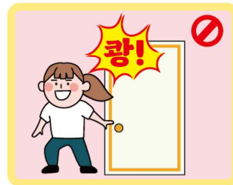
방문 닫는 소리 주의