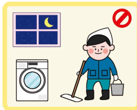
늦은 밤 세탁, 청소 자제