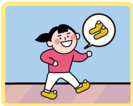
실내화, 매트 착용