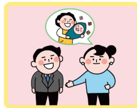
이웃간 사전 양해 구하기