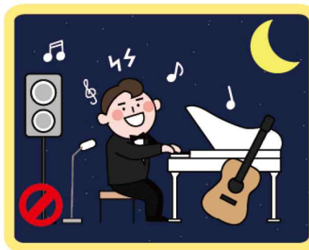
TV, 악기 소리 주의